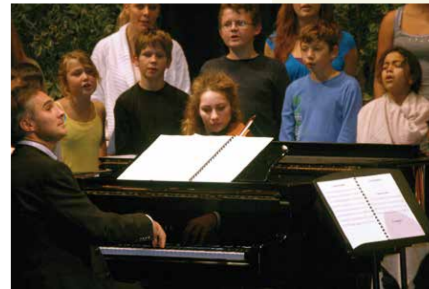
En concert : Manège en couleurs , opéra pour enfants de Sylvain Jaccard

Cultiver chez les enseignants leur envie de partager avec leurs élèves le goût de la musique, d'y apporter la part d'énergie, de travail, de persévérance pour atteindre à cette extraordinaire satisfaction : toucher de ses propres mains une oeuvre magistrale, en maîtriser l'exécution et obtenir un succès personnel.