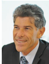
PHILIPPE GNAEGI CONSEILLER D'ETAT EN CHARGE DE L'EDUCATION, DE LA CULTURE ET DES SPORTS

« Nous essayons de mettre en place des structures pour aider chaque étudiant. »