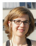
CÉCILE TINGUELY PIANISTE

Le jeune défenseur de Xamax se consacre désormais à temps complet au football. «J'ai la chance de pouvoir être professionnel, je préfère ne pas prendre le risque de me lancer dans des études universitaires pour l'instant», conclut-il.