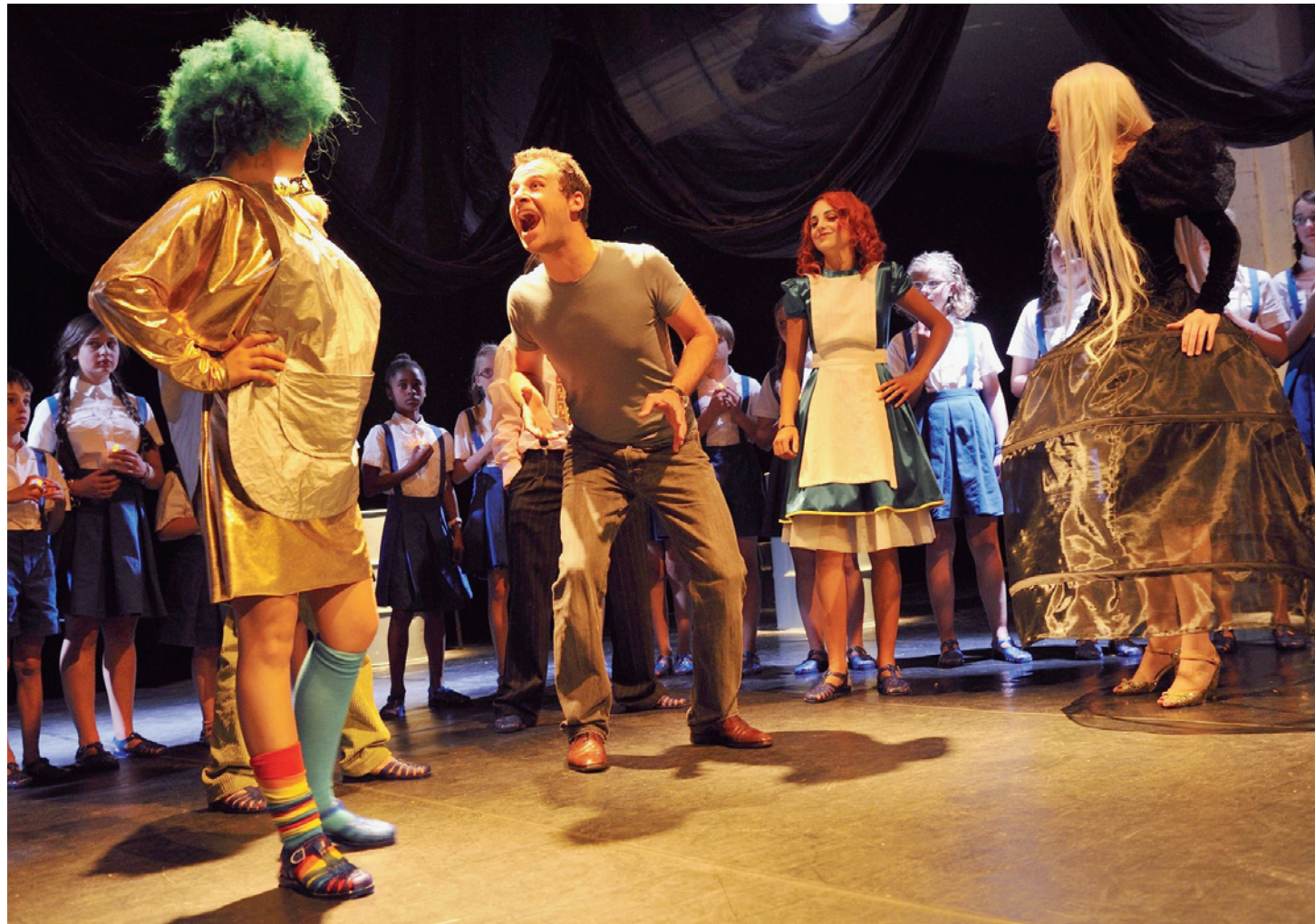
Quand les personnages de fiction prennent à partie le lecteur...