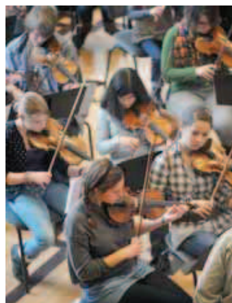
L'Ensemble pour jeunes se produira à Neuchâtel et à La Chaux-de-Fonds.

La salle Faller de La Chaux-de-Fonds ne sera pas le seul lieu où les musiciens feront étalage de leur talent. L'Ensemble pour jeunes se produira samedi à 15h au temple du Bas à Neuchâtel. Il sera au temple Farel de La Chaux-de-Fonds à 17 heures. Dès 17h30, samedi, le Jardin botanique de Neuchâtel résonnera