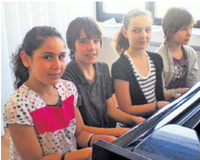
Les enfants pianistes ont parfois du mal à trouver des contacts avec leurs camarades. Le stage leur permet de vivre une relation amicale épanouissante, mais aussi d'améliorer rapidement leur jeu.

Le stage est ouvert prioritairement à tous les élèves inscrits à l'école, et donc habitant dans tout le canton. Le principe est que chacun puisse participer à cette rencontre, quel que soit son âge, avec un niveau instrumental minimal en principe fixé à trois ans de pratique. Les participants préparent avec leur professeur respectif la partie qui leur a été impartie et, durant le week-end de travail, exercent en groupe, 4 heures par jour, le répertoire préparé dans des ensembles de 2 à 4 pianistes, sur un ou deux instruments.